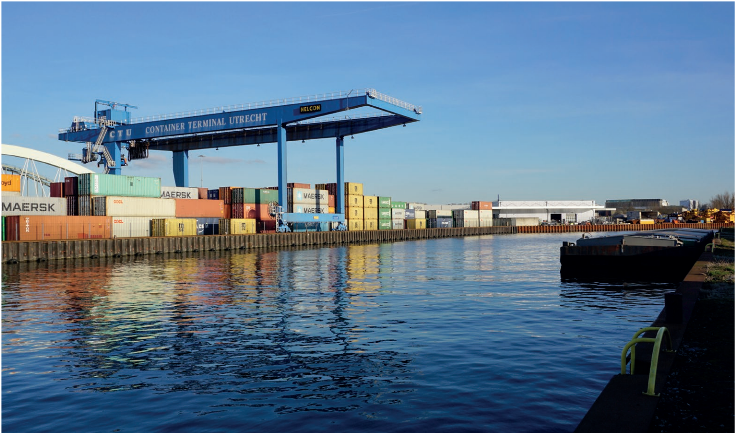
Containerterminal Lage Weide

ringen. OMU heeft een rol gespeeld bij een locatie aan de Reactorweg, waar nu het nieuwe pand van New Wave Textiles staat.